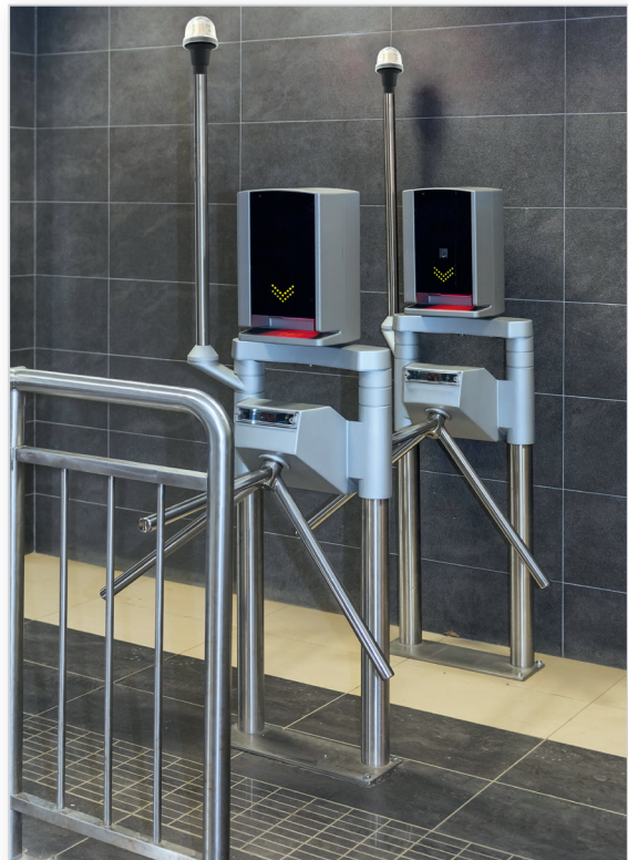
Systèmes d'accès publics