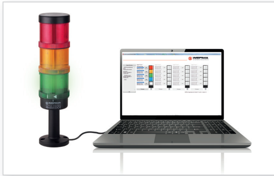
Colonne de signalisation dans les centres d'appel