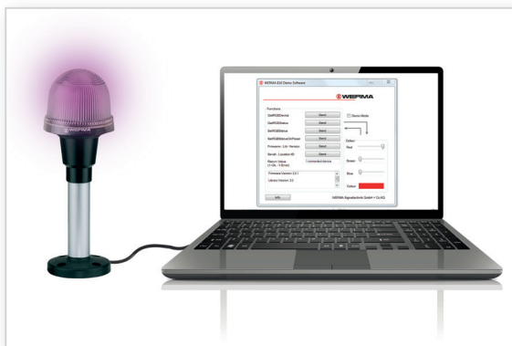
Feu LED dans les centres d'appel