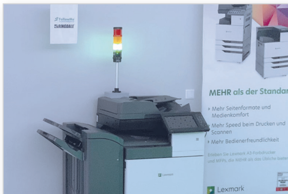
Imprimante au bureau ou dans la production