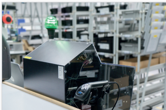
Postes de contrôle dans la production