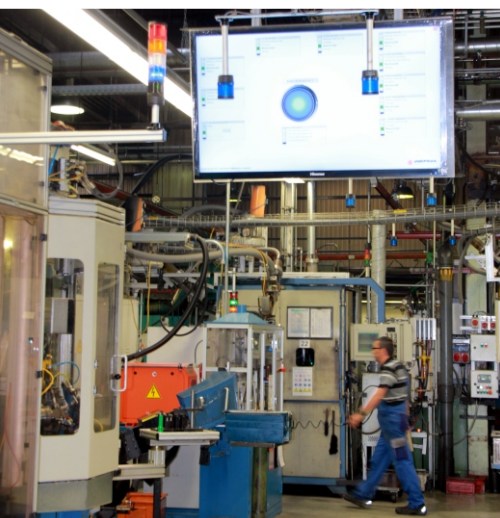
Firma TRW Automotive setzt auf Signalgeräte von WERMA. Zur Visualisierung von Maschinendaten hat der Automobilkonzern Großbildschirme an unterschiedlichen Stationen im Unternehmen anbringen lassen.

In kürzester Zeit kristallisierte sich heraus, dass WIN alle Anforderungen an Flexibilität, Modularität und Erweiterbarkeit von TRW erfüllte. Per Funk wurden Signale an einen zentralen PC übermittelt - eine komplexe Schnittstelle zu den Maschinen selber war nicht notwendig, da als Basis die vorhandene Signalsäule diente.