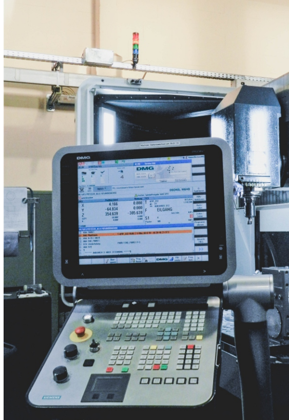
Die Signalsäulen wurden oberhalb der Maschinen montiert und sind auch aus der Ferne gut sichtbar